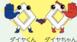
ダイヤくん ダイヤちゃん