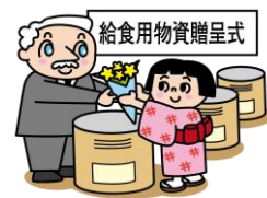
給食用物資贈呈式

戦争が終わっても食料不足は続き、子どもたちの栄養状態が心配されたことから、学校給食の再開を求めた声が高まりました。アメリカのLARA(アジア救援公認団体)から贈られた物資を使い、昭和22(1947)年1月に給食が再開しました。