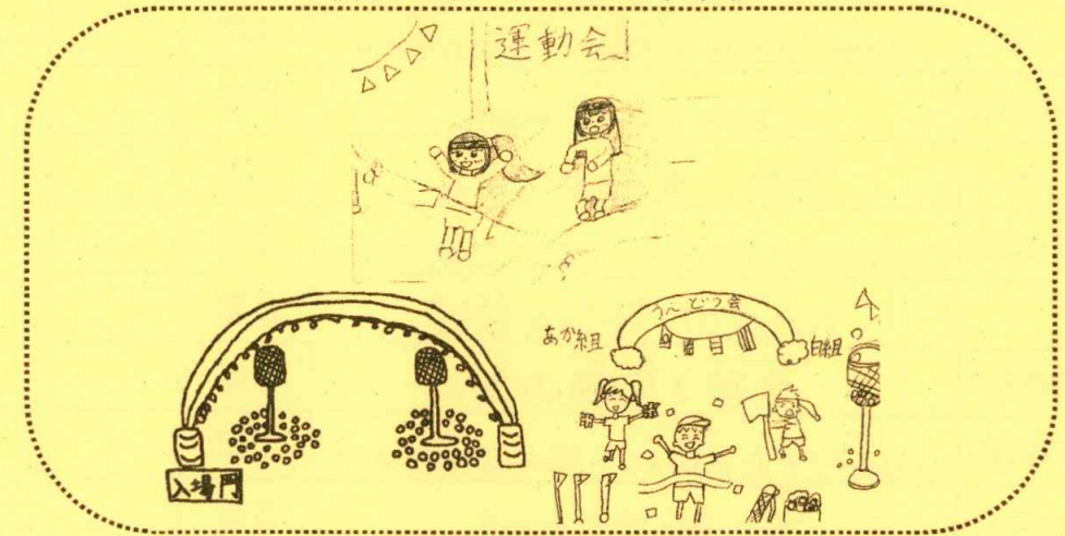
(本校4年生の作品より)