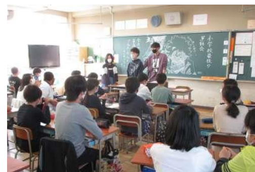
【学校の様子】 2021-11-02 10:38 up