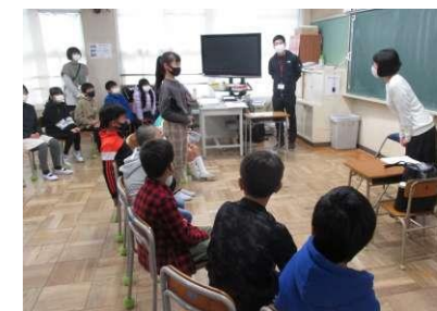
【学校の様子】 2021-11-22 20:25 up