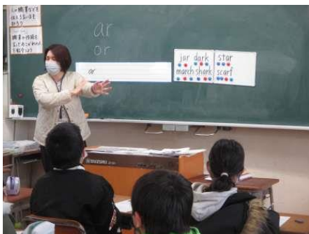
【基礎学力向上のための効果的な指導】