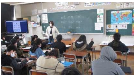
【基礎学力向上のための効果的な指導】