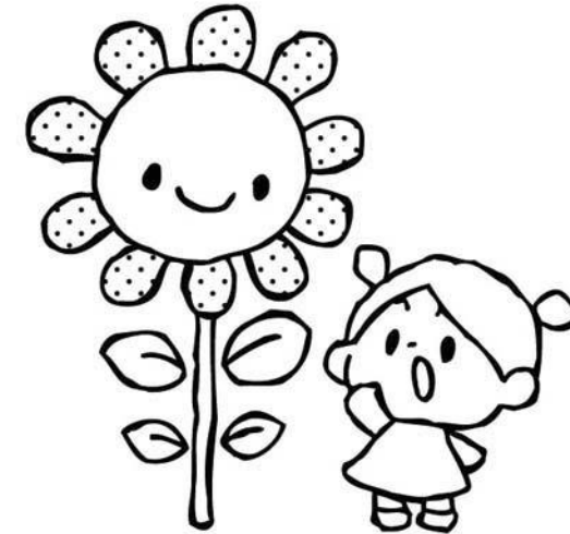
おどうぐばこのなかみ