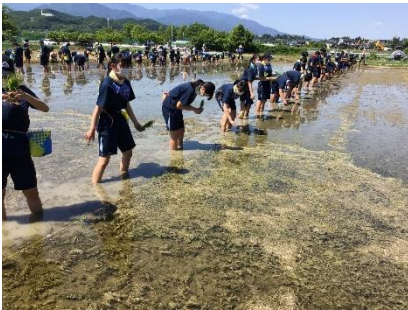
田植えの体験（3年修学旅行）