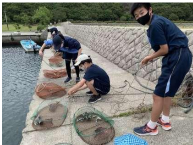
かご漁（1年宿泊学習）

5月29日～31日まで3年生が修学旅行に行ってきました。1年生の宿泊学習や2年生の校外学習も含めて、この時期に行くことができたのは、3年ぶりのことです。長野県飯田市はこの日今年初の気温30度を記録したということで、日中はかなり暑い中田植えやラフティングなどの活動をしましたが、夜はさすがにひんやりして信州に来たことを実感しました。夜のクラスレクやクラスミーティング、そして3日間の生活を通じてたくさんの収穫を得た修学旅行になりました。