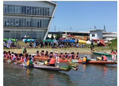
ドラゴンボート（2年校外学習）

また1年生は5月26～27日に淡路島に宿泊学習に、2年生は6月9日に琵琶湖オーパルに校外学習に行きました。淡路島の宿泊では釣りやかご漁、干物づくりなど、海ならではの体験をたくさんしました。2年生はカヌーやドラゴンボートなど普段なかなかできない体験をしました。