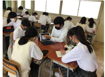
進学フェア（2、3年総合）

もちろん、1年はまだ始まったばかりです。2学期には二中祭も控えています。クラスの力の見せどころであると同時に、つながりを深めていく絶好の機会でもあります。しかし、クラスをつなぐは行事だけで深まるものでもありません。毎日毎日の積み重ね、日々生活をしていく中で生まれていくものです。中学生は、友達思いの優しい人たちばかりです。それは、毎日の学校の様子を見ていて感じます。この優しさや思いやりの心を持ち、毎日を丁寧に過ごしていく中で、友達ばかりではなくクラスや学年、クラブなど様々な場面でのつながりを深めていってほしいと思います。