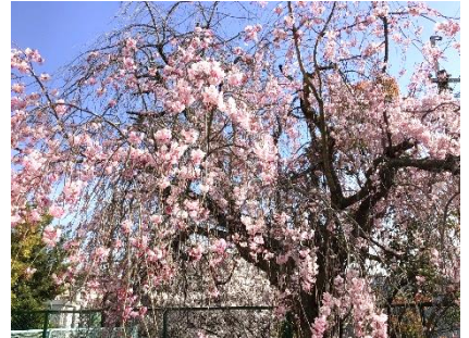
正門脇のしだれ桜

新型コロナウイルス感染症が収束しない中、本年度も学校の教育活動が制約を受けることもあるかと思いますが、今できることを精いっぱい行い、生徒たちが充実した中学校生活を送れるよう、教職員一同尽力いたしますので、保護者の皆様のご協力をよろしくお願いいたします。