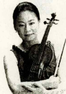
枚方出身の ヴァイオリニスト 五嶋みどりさん

◆五嶋みどりさんに質問しよう 皆さんからの質問に、みどりさんがお答えします。 メールアドレス：info@musicsharing.jp