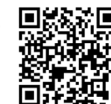
参照: 高等専修学校(専修学校高等課程)って何だろう