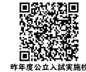
昨年度公立入試実施校

タブレットで閲覧している人は、この check がついている 二次元コードをタップすると関連ページにとべるよ^^