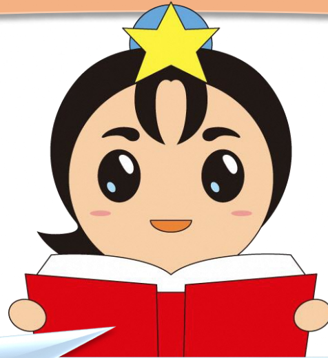
枚方市 ひこぼしくん

ひらかたし こ え が お すこ せい ちょう 枚方市は、子どもが笑顔で健やかに成長できるまちを