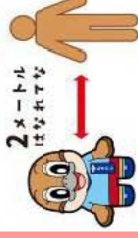
密接・密集を避ける