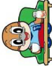
不要不急の外出自粛