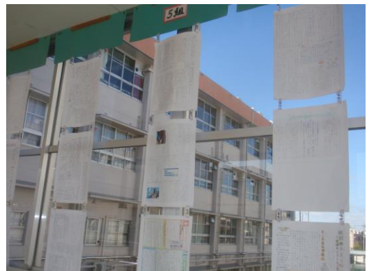
2年生総合では「SDGs」について調べ発表しました。