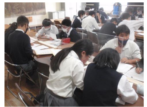
選挙公報を見ながらスクリーンに映し出された候補者の映像を見る生徒