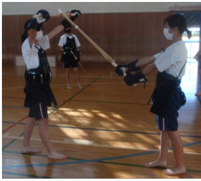
1年生女子体育は剣道です。 ここ数時間の授業でだいぶ上達しました。