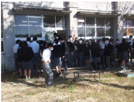
2年生技術の授業では野菜作りを勉強しています。 収穫が楽しみです。