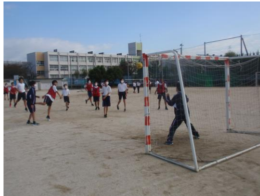
1年生男子体育はハンドボールです。 楽しそうに試合をしていました。