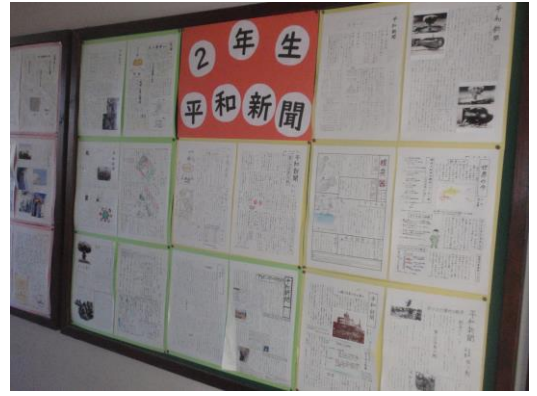
調べ学習「平和新聞」を各学年の掲示板に掲示しています。