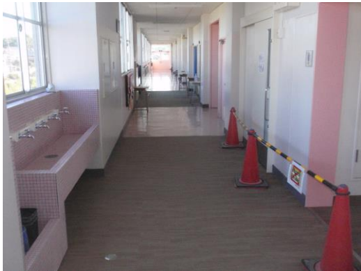
西側トイレ改修が間もなく終了です。 多目的トイレ以外全て女子用となります。