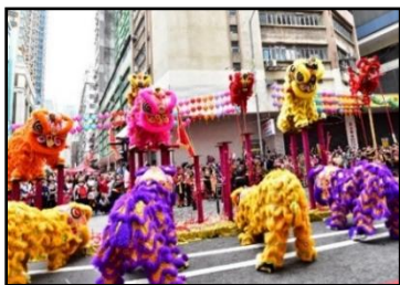
ライオンダンス (中国獅子舞)