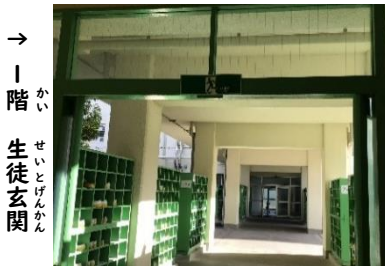
→ 1階 生徒玄関