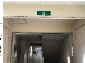
→ 2階 渡り廊下