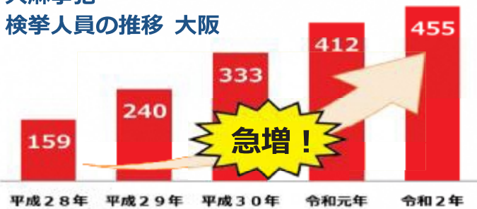
大麻事犯 検挙人員の推移 大阪