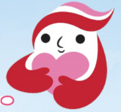
犯罪被害者等支援シンボルマーク 「ギョットちゃん」