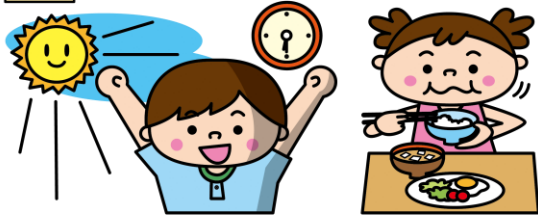
朝の光を浴びる 朝ごはんをよくかんで食べる