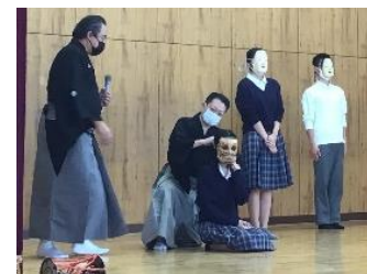
能の授業 (音楽) では本物を体験