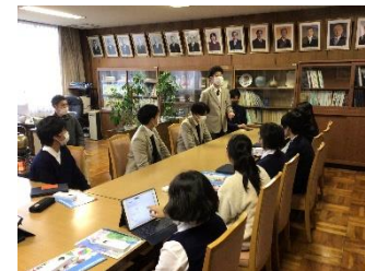
校則見直しに関して高校生とディスカッション