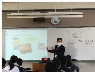
民間入校長による特別授業【総合学習】 (WAKUWAKUプロジェクトの提案書作成について)