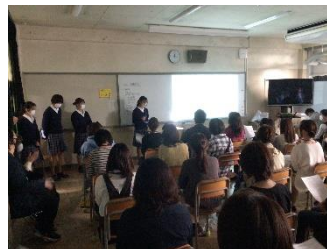
生徒による修学旅行保護者説明会