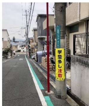
3月4日 ポイント4、5、7に設置 しました。