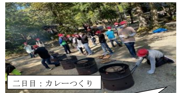
二日目：カレーづくり

楽しみにしていた5年生宿泊学習。2度の延期でやっと、10月29日、30日に実施することができました。まさしく「三度目の正直」でした。