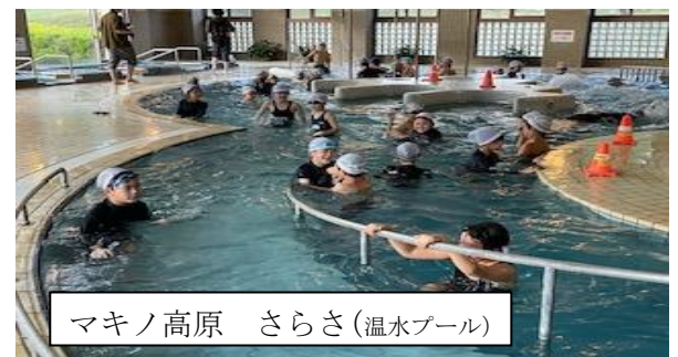
マキノ高原 さらさ(温水プール)