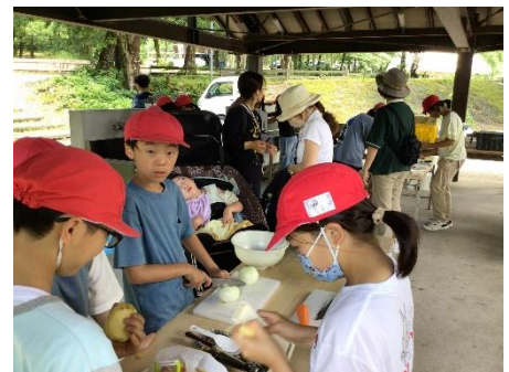
5年宿泊学習。上：魚つかみ 下：飯盒すいいさん