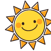
3-2 SUN & PEACE ～Let's 冒険～