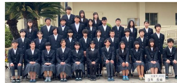
3-5 Let's enjoy てを取り合っ らいねん わらいあえるように きょうを大切にする 学級