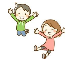
3-4 Make The Future ～何事にも積極的に～