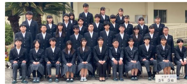
3-3 #愛組心 ～日々是好日～